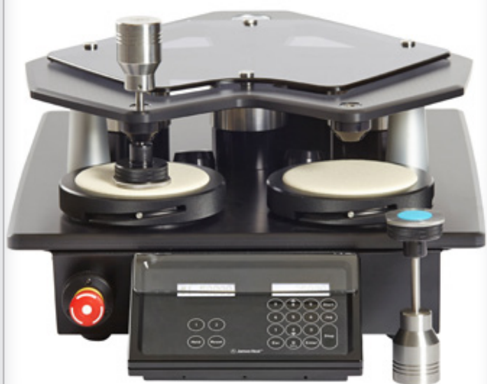
EN 388 § 6.1 TESTS D'ABRASION