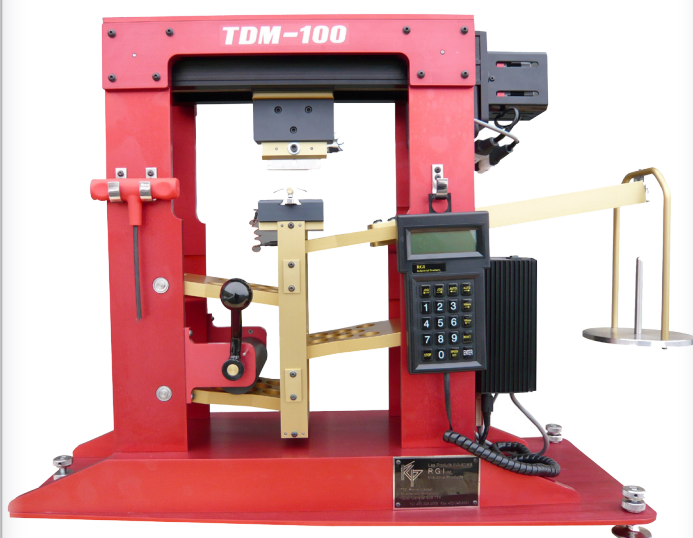
EN 388 § 6.3 TESTS DE RÉSISTANCE A LA COUPURE