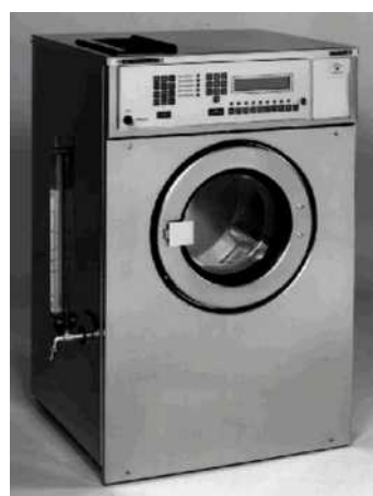
Wascator FOM 71 MP/Lab (1990-2002)