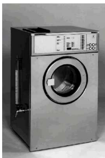
Wascator FOM 71 MP (1984-1993)