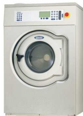
Wascator FOM 71 CLS (2002-)